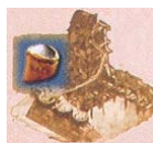
Mine de sel